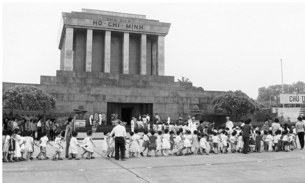
Lăng Chủ tịch Hồ Chí Minh

Mai về miền Nam th ơng trào n ớc mắt Muốn làm con chim hót quanh lăng Bác Muốn làm đoá hoa toả h ơng đâu đây Muốn làm cây tre trung hiếu (3) chốn này.