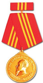
HUÂN CHƯƠNG HỒ CHÍ MINH