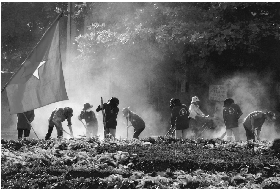
Thanh niên học sinh tham gia hoạt động bảo vệ môi trường.

Bảo vệ và sử dụng tiết kiệm tài nguyên thiên nhiên : bảo vệ nguồn nước, bảo vệ các giống loài động, thực vật ; không đốt phá rừng, khai thác khoáng sản một cách bừa bãi ; không dùng chất nổ, điện,... để đánh bắt thủy, hải sản ; không tham gia vào các hành vi vận chuyển, mua bán động vật quý hiếm.