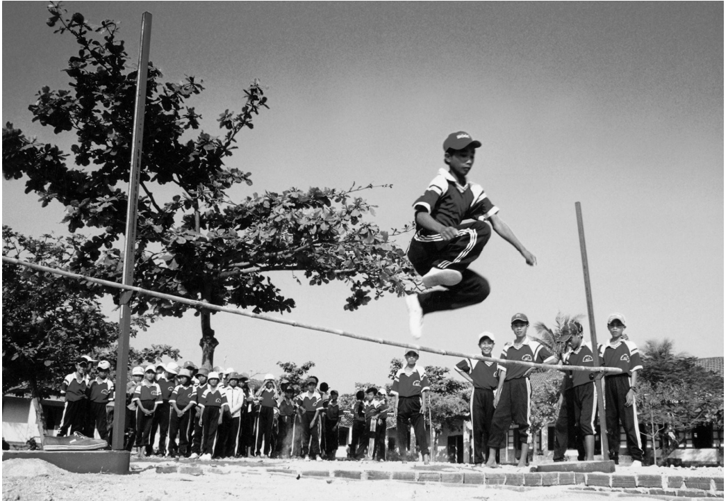
Tích cực rèn luyện thân thể.

– Vận động bạn bè, người thân thực hiện tốt nghĩa vụ bảo vệ Tổ quốc.