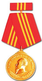
HUÂN CHƯƠNG HỒ CHÍ MINH