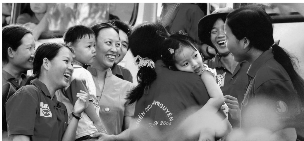
Thanh niên tình nguyện – đi dân nhớ, ở dân thương.

– Tích cực tham gia các hoạt động tập thể, hoạt động xã hội do nhà trường, địa phương tổ chức ; đồng thời vận động bạn bè và mọi người cùng tham gia.