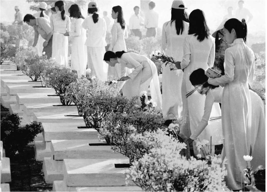
Thanh niên học sinh thăm viếng nghĩa trang liệt sĩ.