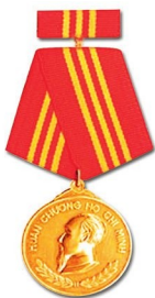
HUÂN CHƯƠNG HỒ CHÍ MINH