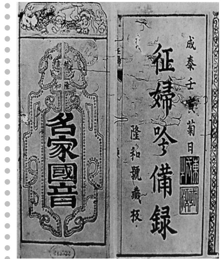
nh bìa cuốn Chinh phụ ngâm bị lục

Sắt cầm (6) gượng gảy ngón đàn, Dây uyên (7) kinh đứt phím loan (8) ngại chùng.