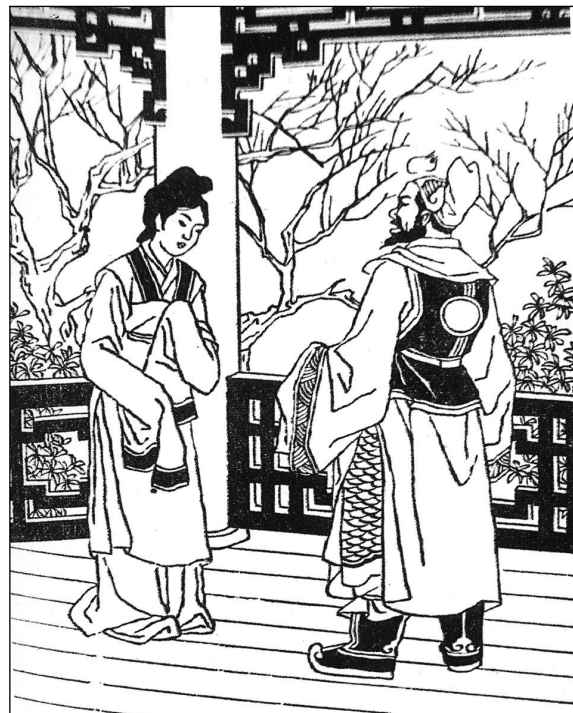
Thúy Kiều – Từ Hải

Cuộc đời Kiều tưởng như bế tắc hoàn toàn khi lần thứ hai rơi vào lầu xanh thì Từ Hải bỗng xuất hiện và đưa Kiều thoát khỏi cảnh ô nhục. Hai người sống hạnh phúc “Trai anh hùng gái thuyền quyên Phỉ nguyên sánh phượng đẹp duyên cưới rồng”. Nhưng Từ Hải không bằng lòng với cuộc sống êm đềm bên cạnh nàng Kiều tài sắc, chàng muốn có sự nghiệp lớn nên sau nửa năm đã từ biệt Kiều ra đi. Đoạn trích (từ câu 2213 đến câu 2230) bao gồm ngôn ngữ tác giả và ngôn ngữ đối thoại cho thấy chí khí của Từ Hải.