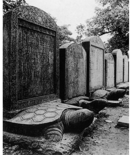
Bia Tiến sĩ, Văn Miếu, Hà Nội

Để phát triển giáo dục, khuyến khích nhân tài, từ năm 1439 trở đi, nhà nước phong kiến triều Lê đặt ra lệ xướng danh, yết bảng, ban mũ áo, cấp ngựa, đai yến và vinh quy bái tổ cho những người đỗ đạt cao. Bài Đại Bảo tam niên Nhâm Tuất khoa tiến sĩ đề danh kí Bài kí đề danh tiến sĩ khoa Nhâm Tuất, niên hiệu Đại Bảo thứ ba (1442) do Thân Nhân Trung soạn năm 1484 thời Hồng Đức. Đây là một trong 82 bài văn bia ở Văn Miếu (Hà Nội).