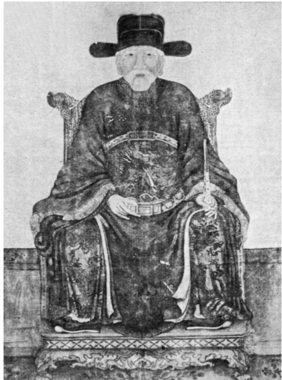
Nguyễn Trãi ( Tranh chân dung )

Nắm vững những đặc trưng cơ bản của thể cáo, đồng thời thấy được những sáng tạo của Nguyễn Trãi trong Đại cáo bình Ngô .