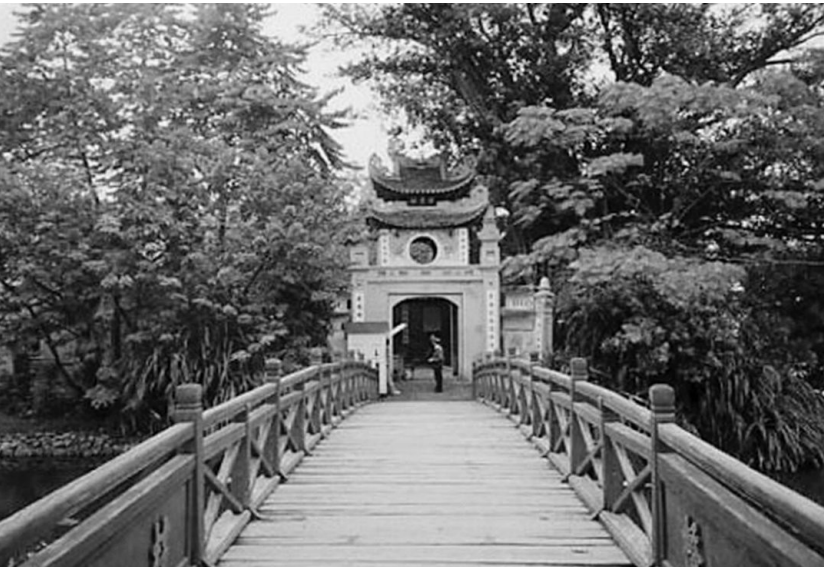
Đền Ngọc Sơn (Hà Nội)

Đến thăm đền Ngọc Sơn, hình tượng kiến trúc đầu tiên gây ấn tượng là Tháp Bút, Đài Nghiên một biểu tượng của trí tuệ văn hoá. Tháp Bút dựng trên núi Ngọc Bội, đỉnh tháp có ngọn bút trở lên trời xanh cao vút, trên mình tháp là ba chữ son tả thanh thiên (viết lên trời xanh) đầy kiêu hãnh, hai bên lối đi có đắp