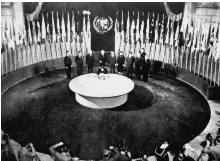
Hình 2. Lễ kí Hiến chương Liên hợp quốc tại Xan Phranxixcô (Mĩ)

Sau Hội nghị Ianta không lâu, từ ngày 25 – 4 đến ngày 26 – 6 – 1945, một hội nghị quốc tế họp tại Xan Phranxixcô (Mĩ) với sự tham gia của đại biểu 50 nước, để thông qua bản Hiến chương và tuyên bố thành lập tổ chức Liên hợp quốc . Ngày 24 – 10 – 1945, sau khi được Quốc hội các nước thành viên phê chuẩn, bản Hiến chương chính thức có hiệu lực (1) .