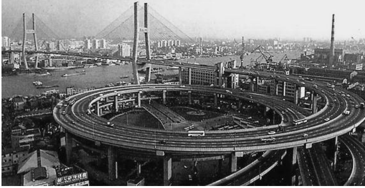
Hình 9. Cầu Nam Phố ở Thượng Hải

Năm 1964, Trung Quốc thử thành công bom nguyên tử. Chương trình thám hiểm không gian được thực hiện từ năm 1992. Từ tháng 11 – 1999 đến tháng 3 – 2003, Trung Quốc đã phóng 4 con tàu “Thần Châu” với chế độ tự động, và ngày 15 – 10 – 2003, con tàu “Thần Châu 5” cùng nhà du hành vũ trụ Dương Lợi Vĩ đã bay vào không gian vũ trụ. Sự kiện này đưa Trung Quốc trở thành quốc gia thứ ba trên thế giới (sau Nga, Mĩ) có tàu cùng với con người bay vào vũ trụ.