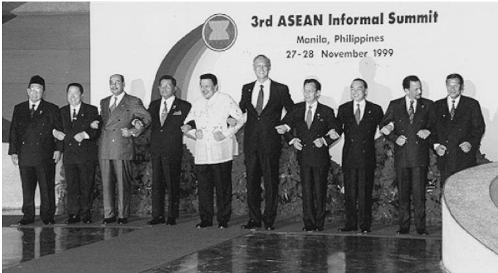
Hình 11. Các nhà lãnh đạo mười nước ASEAN tại Hội nghị cấp cao (không chính thức) lần thứ ba (Philippines, tháng 11 – 1999)

Việt Nam trở thành thành viên thứ bảy của ASEAN. Tháng 7 – 1997, Lào và Mianma gia nhập ASEAN. Đến năm 1999, Campuchia được kết nạp vào tổ chức này.