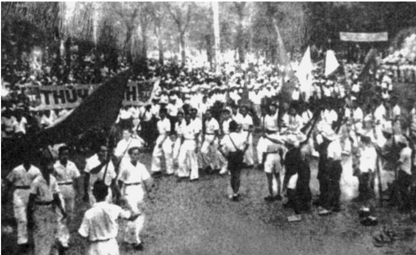
Hình 42. Nhân dân Sài Gòn trong những ngày tháng 8 – 1945

Khởi nghĩa thắng lợi ở ba thành phố lớn (Hà Nội, Huế, Sài Gòn) đã tác động mạnh đến các địa phương trong cả nước. Nhiều nơi, từ rừng núi, nông thôn đến thành thị nối tiếp nhau khởi nghĩa. Đồng Nai Thượng và Hà Tiên là những địa phương giành chính quyền muộn nhất, vào ngày 28 – 8.