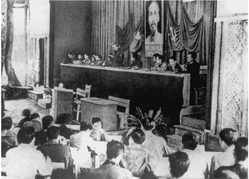
Hình 51. Đại hội đại biểu lần thứ II của Đảng (2 – 1951)

Đại hội đại biểu lần thứ II đánh dấu bước phát triển mới trong quá trình trưởng thành và lãnh đạo cách mạng của Đảng ta, là “Đại hội kháng chiến thắng lợi”.